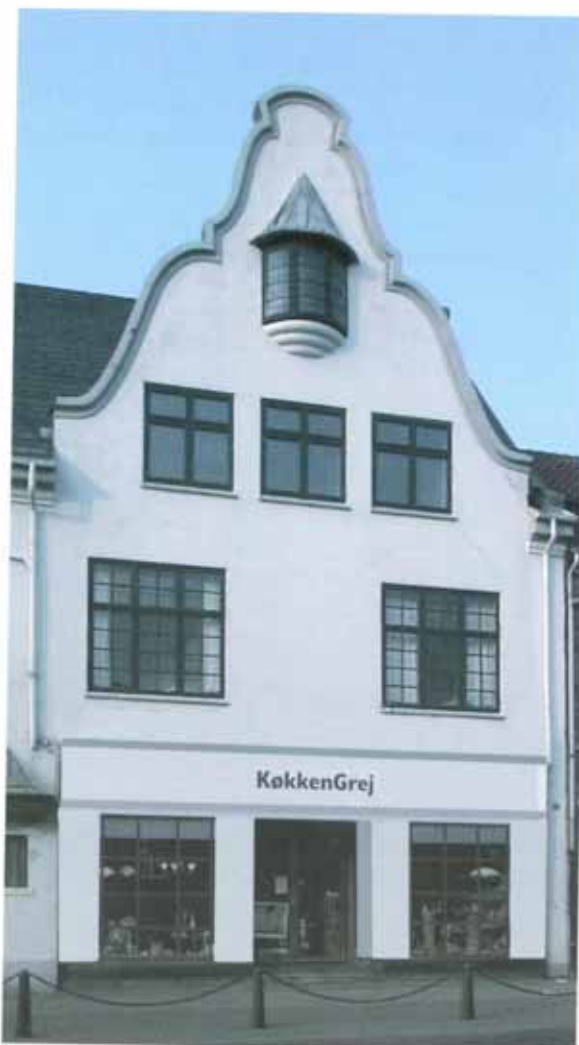
Hus i Bredgade. Tænkt eksempel på facadeændring.

Der opnås ofte en rimelig balance i facaden og en god fornemmelse af, at huset atter står solidt på jorden ved at føre en del af facaden mellem vinduerne i overetagen ned til soklen.