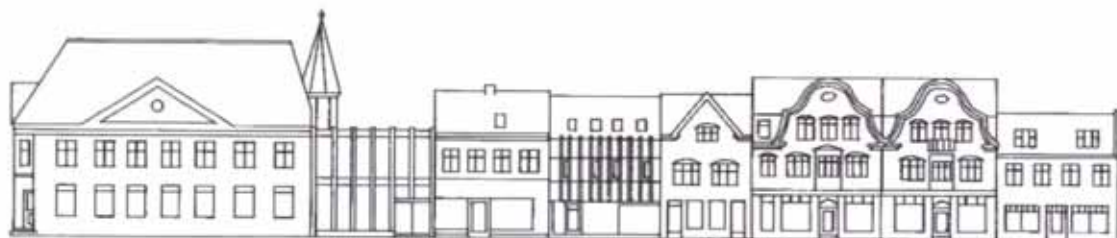
1. En harmonisk facaderække med individuelt opførte bygninger.