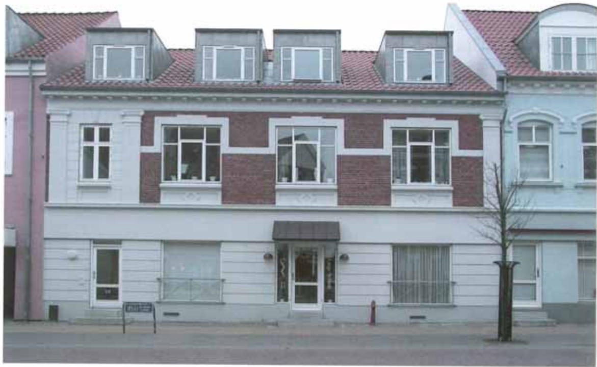
Eksempler fra Bredgade: Tagudhæng, kviste, rygninger og spir danner afslutningen på husene, afhængig af gadens bredde og den vinkel, man ser husene i.