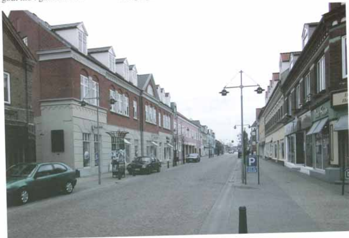
Bredgade i Brønderslev indeholder flere gode eksempler på store, men veltilpassede byhuse.

Det gælder altså ikke om at lave kopier af de gamle huse, så man ikke kan se, om en bygning er opført i 1890'erne eller 1990'erne.