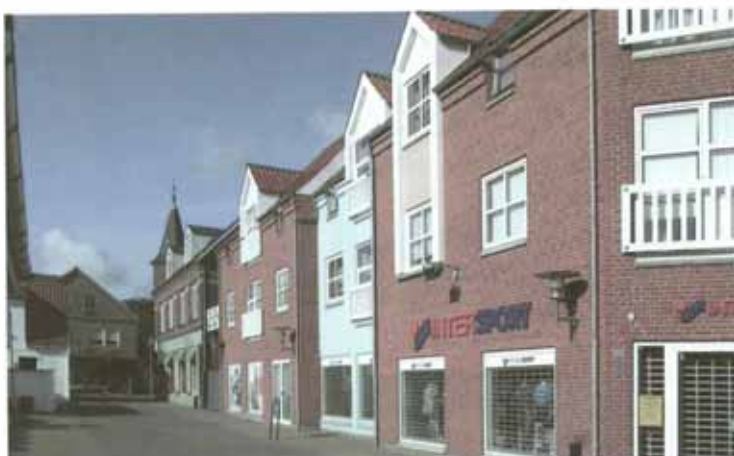
Eksempel på nye og gamle bygninger i god indbyrdes harmoni.

Højden skal afpasses efter nabohusene og gadens bredde. Den almindelige tagform i