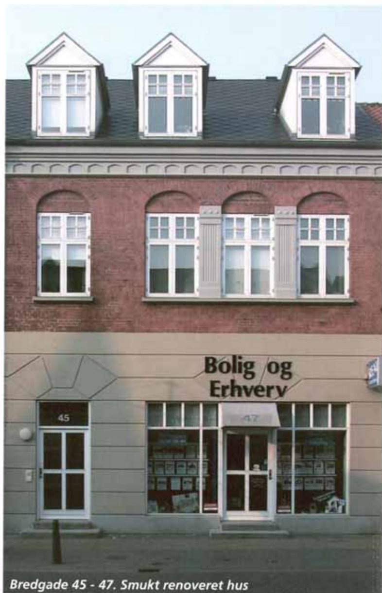
Bredgade 45 - 47. Smukt renoveret hus

De fleste huse er smukke nok til at stå alene.