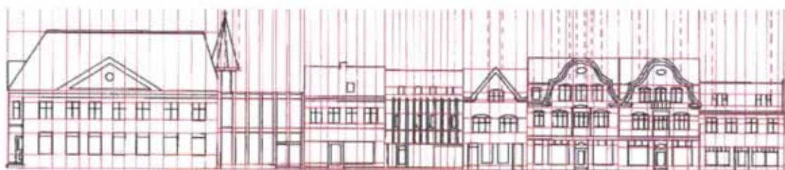
2. Hvis der trækkes linier for vinduer og døre, etager, tag mm., vil der fremkomme et mønster i såvel den enkelte bygning som i hele facaderækken.