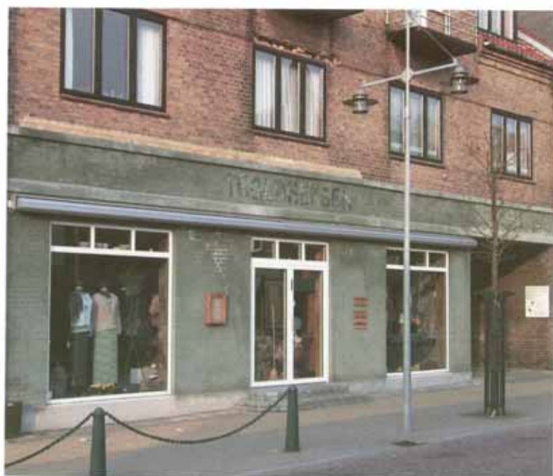
Bredgade. Smukt og forstandigt renoveret byhus med butik.

Alt i alt har Brønderslev i dag en forholdsvis helstøbt og hyggelig bykerne med mange spændende huse og mange gode gadeforløb. Vel er byplanen præget af en form for planlægning, der gør gaderne forholdsvis lige og dermed ikke så visuelt spændende og uforudsigelige som gaderne i vore ældre byer. Alligevel har byen mange af de traditionelle købstadskvaliteter, med traditionelle byhuse opført i gadelinien. Det betyder, at Brønderslev i dag har et godt byplan- og bygningsgrundlag for at videreudvikle specielt bymidte som et smukt og harmo-