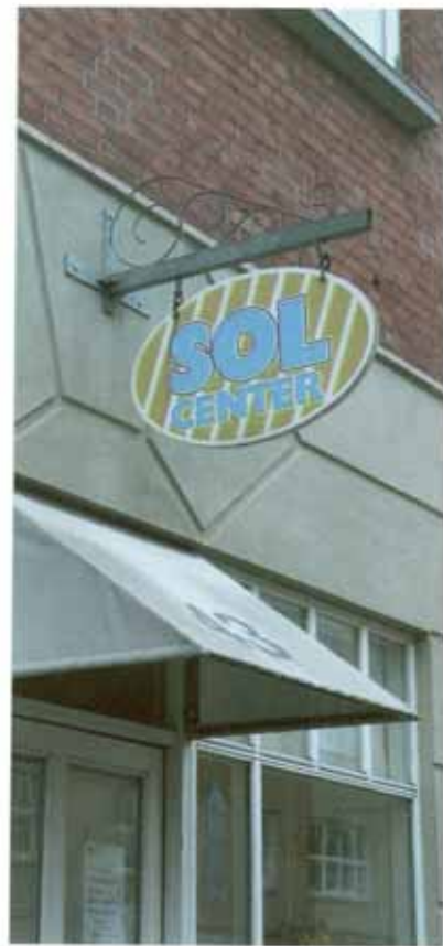
3 eksempler på tidssvarende og veltilpasset skiltning, der underordner sig bygningens arkitektur.